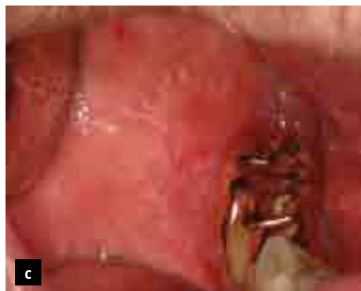
Figur II a-c. Lichenoid kontaktreaktion i kindslemhinna.