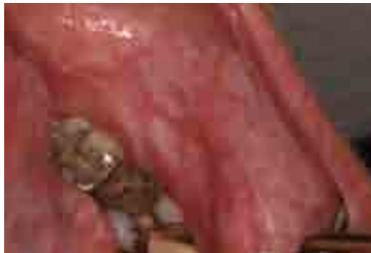
Figur I. Mer omfattande lichenförändring, oral lichen planus.

Hypotesen var att patienter med dentalguld också hade högre koncentrationer av guld i blod jämfört med patienter utan dentalguld. Målet med studien var att bestämma guldhalt i helblod (B-Au) relaterat till förekomst av dentalguld och antal guldtyr, och att jämföra med patienter utan dentalguld. Av de 102 patienterna i delarbete 1 ställde 80 patienter upp på att ta ett blodprov